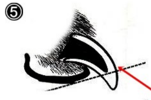
⑤ Kun kynnen pitää lyhyenä, riski leikata ytimeen pienenee.